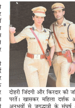
दोहरी जिंदगी और किरदार की जटिल परतें। खासकर महिला दर्शक अपने अनुभवों से जगद्धात्री के संघर्ष और